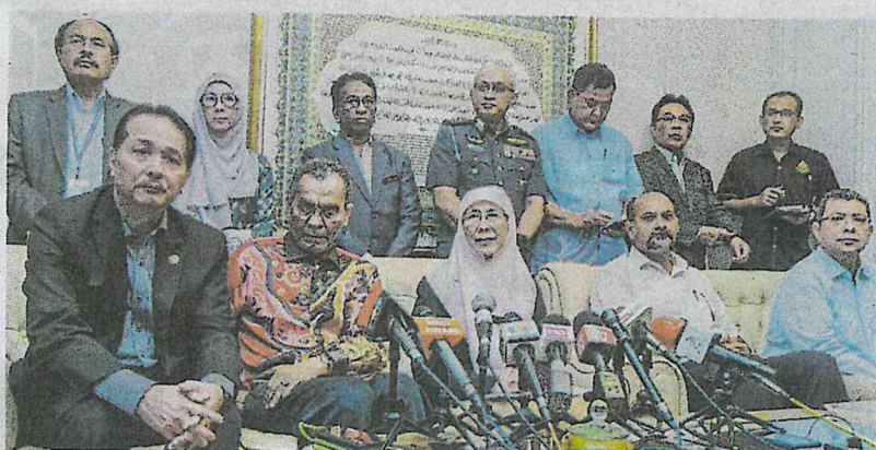
Dr Wan Azizah ketika sidang media selepas mempengerusikan mesyuarat Penyelarasan Kluster Novel Coronavirus (2019-nCoV) di Putrajaya, semalam.

"Daripada situ sudah kita buat saringan. (Kemudian) kawalan kemasukan di pintu masuk negara diperketatkan, termasuk semua penumpang penerbangan dari China termasuk warga Malaysia wajib melalui saringan kesihatan terperinci," katanya selepas mempengerusikan mesyuarat Penyelarasan Kluster Novel Coronavirus (2019-nCoV) petang semalam.