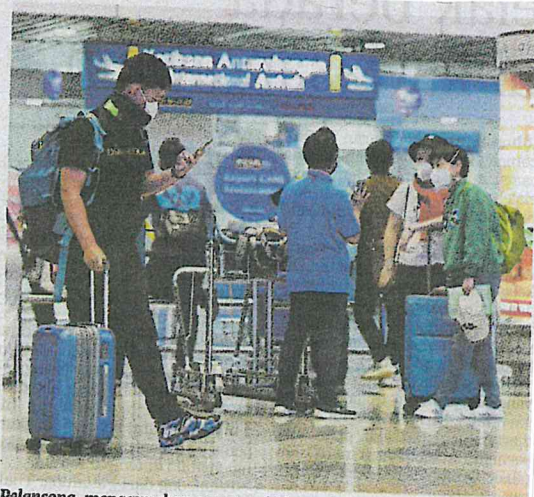
Pelancong menggunakan penutup hidung dan mulut sebagai langkah pencegahan ketika tiba di KLIA, semalam.

Ditanya sama ada Malaysia perlu melaksanakan langkah sa-